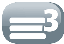
Filtro a 3 strati