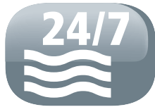
Scarico continuo dell'acqua