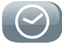
Timer (8 ore)